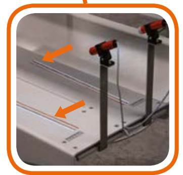
Linee di riferimento per piegatura References for easy folding