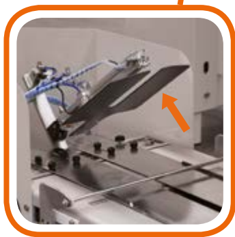
Dime di piegatura Folding templates