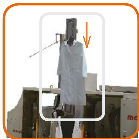
CARICATORE automatico Automatic LOADER