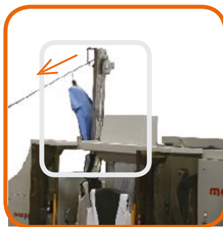
SCARICATORE automatico Automatic OFFLOADER