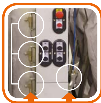
B-Spruzzatura automatica. B-Automatic spray unit