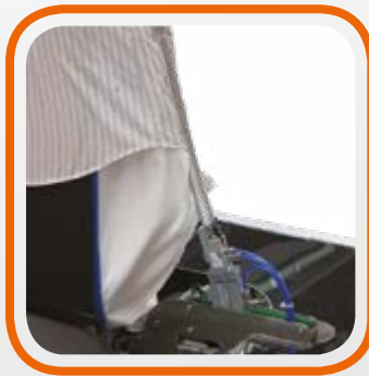
Sistema di pinze laterali Clamping System