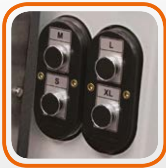
Sistema con 4 pulsanti per la selezione delle taglie 4 buttons system for size selection

Is equipped with the new dummies SlimFit system: the internal expanders and external pines allows to properly position shirts with front and rear pleats (SlimFit).