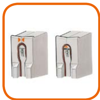
A- Sistema per lo stiro delle spalle e del carrè. A- Shoulder Pressing System.