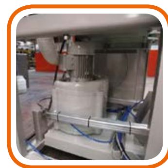
C-Aspirazione incorporata. C-Integrated Vacuum.