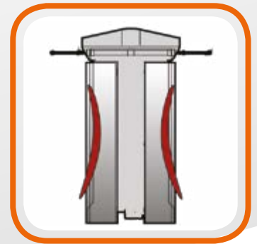
Gonfiabili laterali Push & Traction System